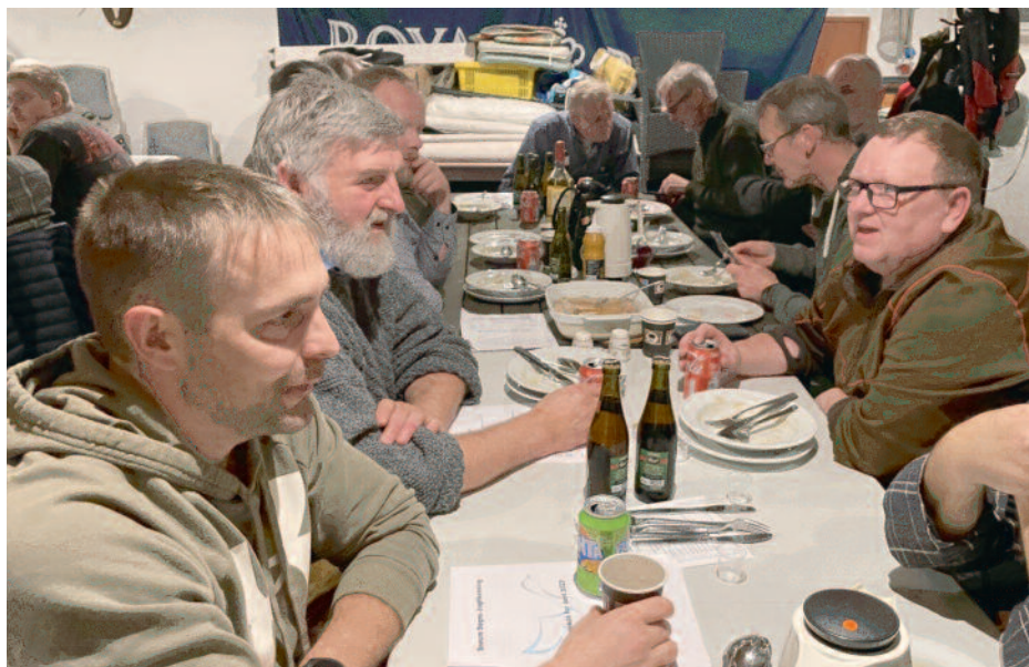
Gule ærter efter generalforsamlingen